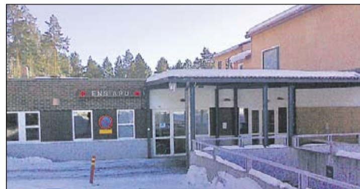
Tavoitteena on turvata yhdenvertaisten palveluiden saanti koko terveydenhuoltoalueella.

Terveydenhuoltoalueella on erityisesti aikuisten ja ikääntyneiden terveyden edistämistä ja ennalta ehkäisyä kehitetty. Hoitohenkilökunnan työnkuvia on muutettu palvelemaan paremmin asiakasta. Perusterveydenhuollon palvelut on turvattu uudistuksella entistä paremmin. Lääkäreiden, hoitajien ja erityistyöntekijöiden