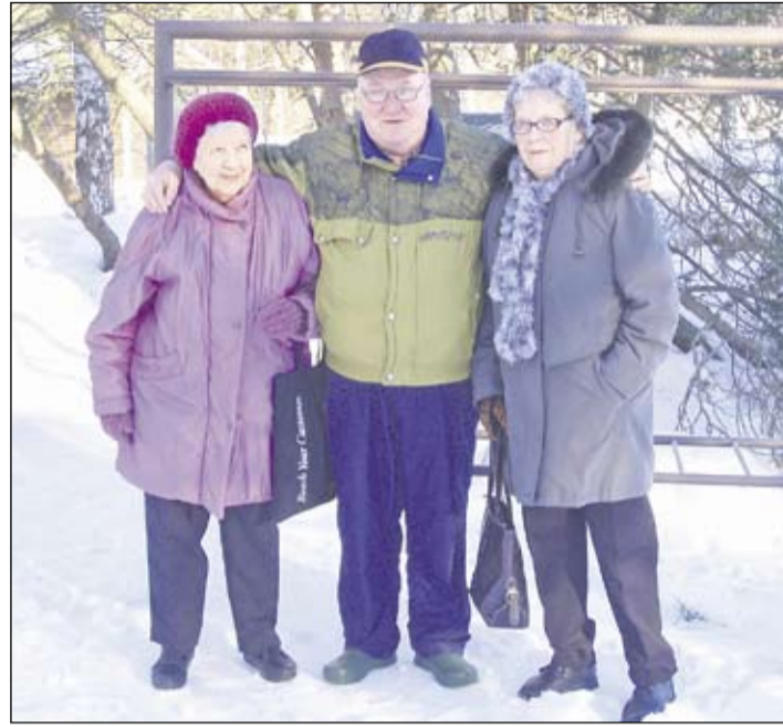
Mäntäläisiä ikäihmiä lähdössä seurakunnan palvelupäivään Eskolan leirikeskukseen. Suositussa päivässä on ohjelmaa, hengen ja ruumiin ravintoa, virkistystä ja yhdessäoloa.

Ikäihmisille tulee tarjota yhteiskunnallisia palveluja edulliseen hintaan tervey-